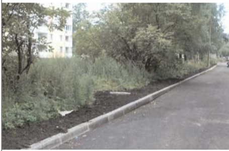
Металлистов, д. 84 - 86

Этим летом в "Финляндском округе" всюю шли благоустроительные работы. Продолжаются они и наступившей осенью.