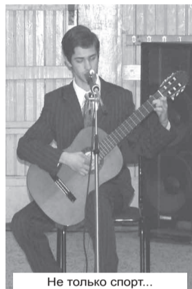
Не только спорт...