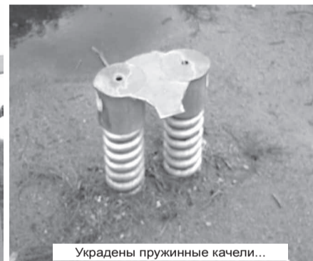
Украдены пружинные качели...