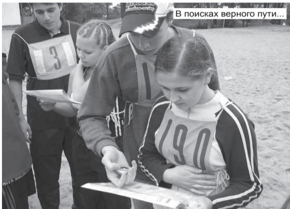
В поисках верного пути...