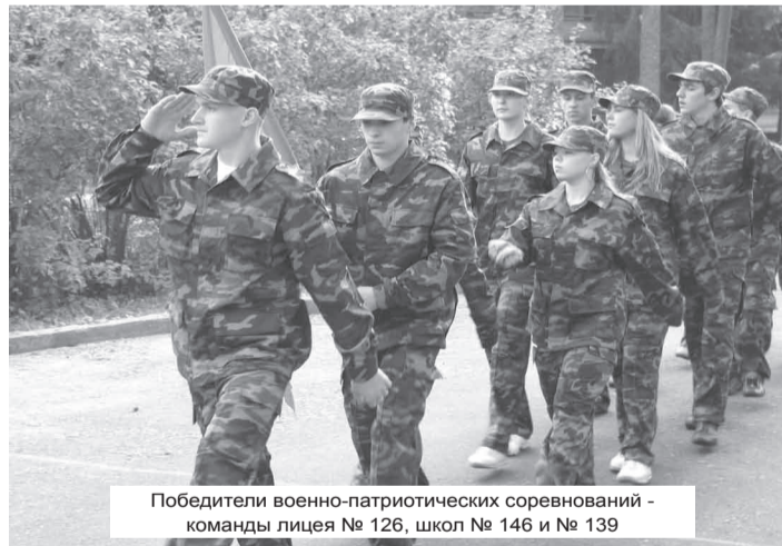
Победители военно-патриотических соревнований – команды лицея № 126, школ № 146 и № 139

«Праздник урожая» проводится в этом году уже во второй раз. 30 сентября на большой площадке рядом с площадью Калинина работали концертная сцена, бесплатные аттракционы для ребят, а главное – торговые ряды, в которых овощи и фрукты нового урожая продавали хозяйства Ленинградской области.