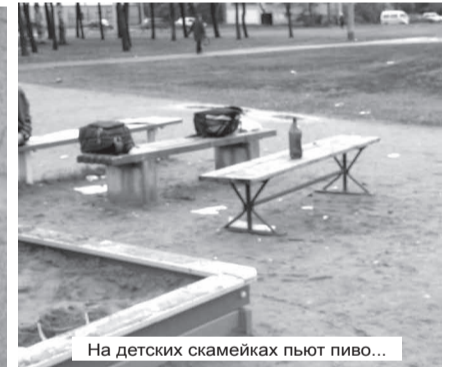
На детских скамейках пьют пиво...