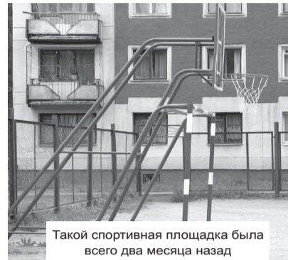
Такой спортивная площадка была всего два месяца назад