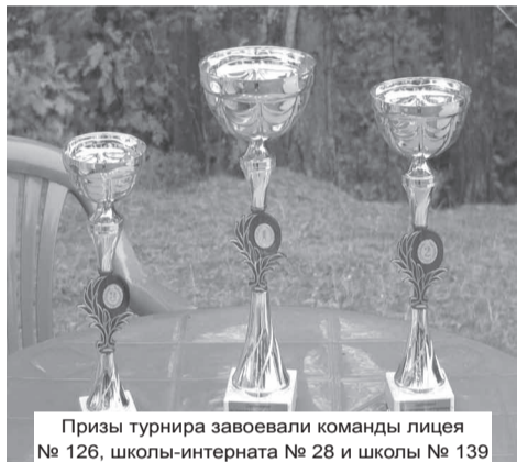
Призы турнира завоевали команды лицея № 126, школы-интерната № 28 и школы № 139