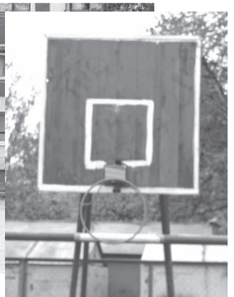
Второй щит доломали следом...