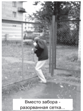
Вместо забора - разорванная сетка...