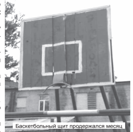
Баскетбольный щит продержался месяц