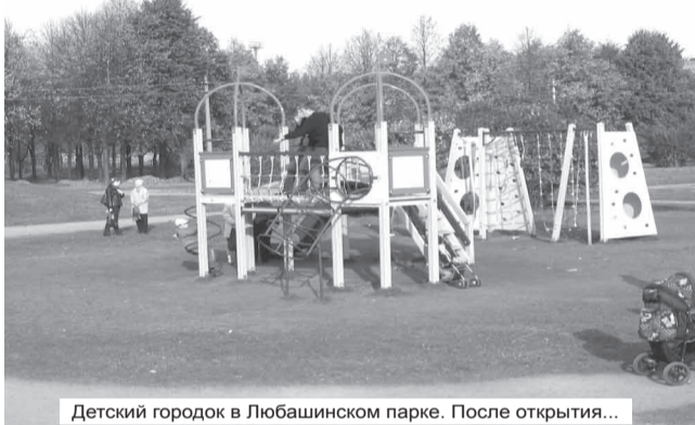
Детский городок в Любашинском парке. После открытия...