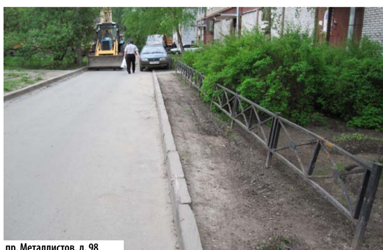
пр. Металлистов, д. 98