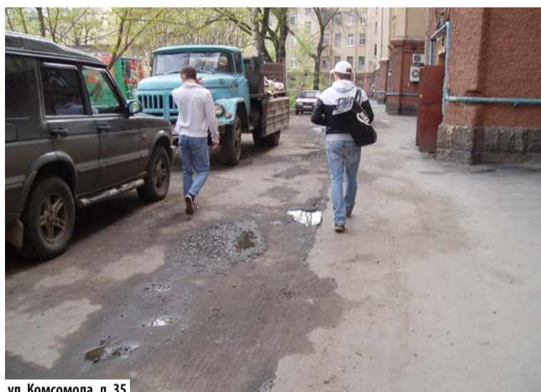
ул. Комсомола, д. 35