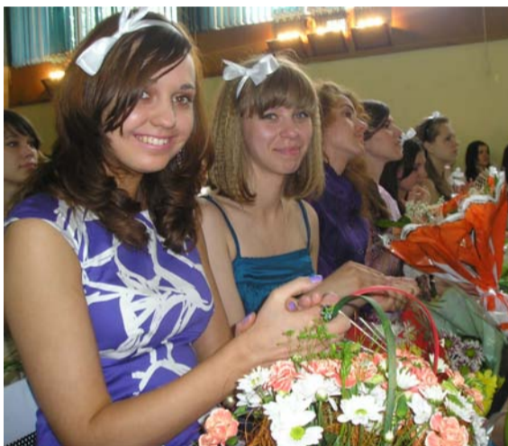
Будущие воспитатели детского сада. Выпускники Педагогического колледжа № 2

учебы в колледже, пели песни, исполняли танцы, показывали интересные видеофильмы собственного производства, в которых подробно, до мелочей рассказали о студенческой жизни: как питались в столовой, как добираться в переполненном автобусе на лекции, как готовились к экзаменам. И, конечно же, принимали поздравления от своих педагогов, студентов младших курсов, представителей местной власти и своих будущих воспитанников, которые уже ждут их в детских садах.