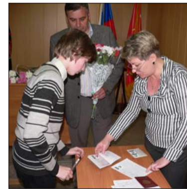
Первая серьезная подпись

Юным обладателям паспортов это мероприятие запомнится надолго.