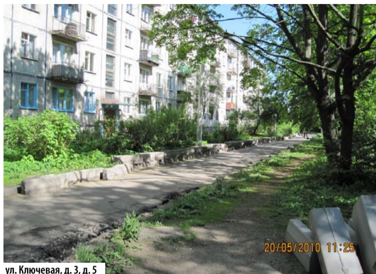
ул. Ключевая, д. 3, д. 5