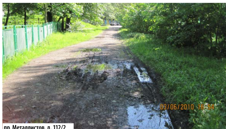
пр. Металлистов, д. 112/2