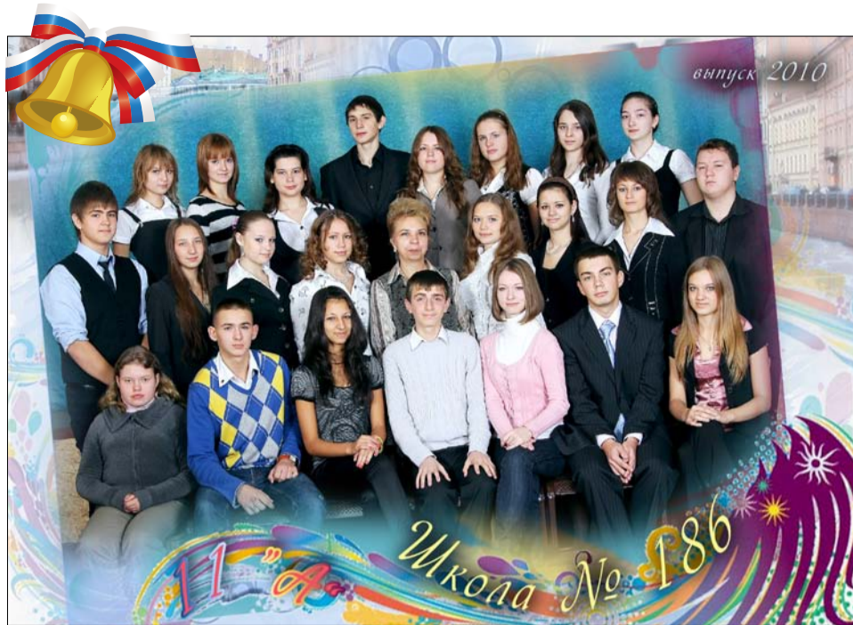
Самый «звездный» класс! 11 «А» школы № 186