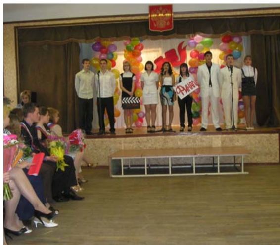
Из сериала «Школа» в сериал «Жизнь». На последнем звонке в школе № 186