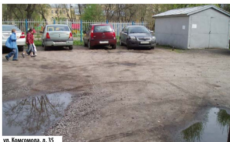
ул. Комсомола, д. 35