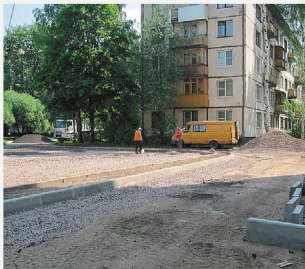
ул. Замшина, д. 52/2