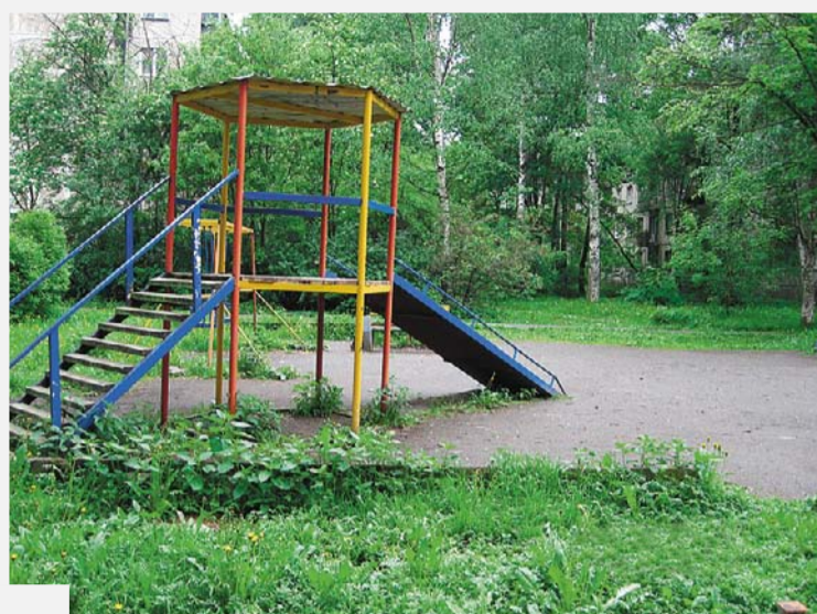
пр. Металлистов, д. 77, до начала благоустройства

По адресам: ул. Ключевая, д. д. 19, 23, 29 ул. Антоновская, д. 12 в августе планируется провести работы по организации и устройству дополнительных парковочных мест, замене бортовых камней, ремонту щебеночно-набивной дорожки, восстановлению газона и асфальтированию проезжей части.