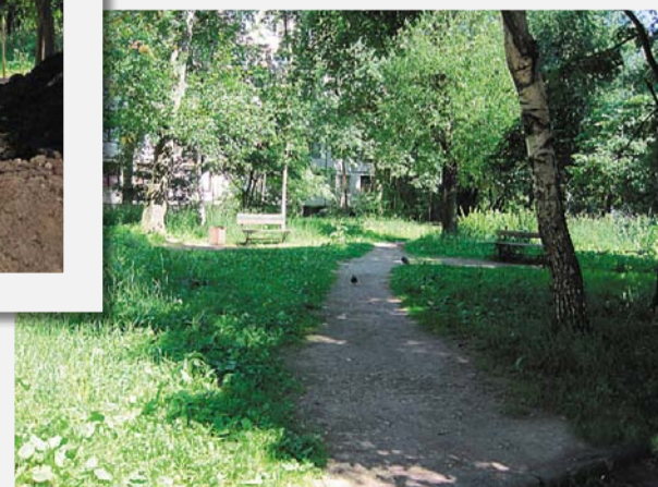
ул. Замшина, д. 52/2