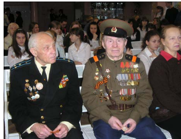
Ветераны МО Финляндский округ на мероприятии в школе

Несколько записей со слов ветеранов уже сделаны. Но мы готовы выслушать и записать историю каждого бывшего солдата, моряка, офицера войны, чтобы лучше узнать историю