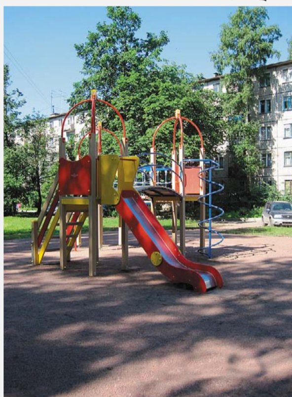
Пискаревский пр., д. 20