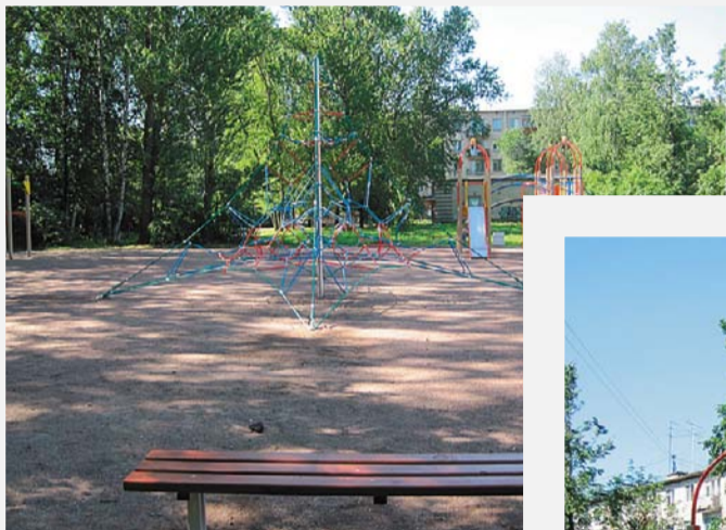
Пискаревский пр., д. 20