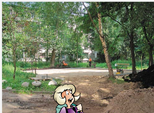
ул. Замшина, д. 52/2