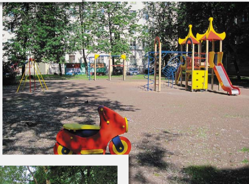
Кондратьевский пр., д. 39