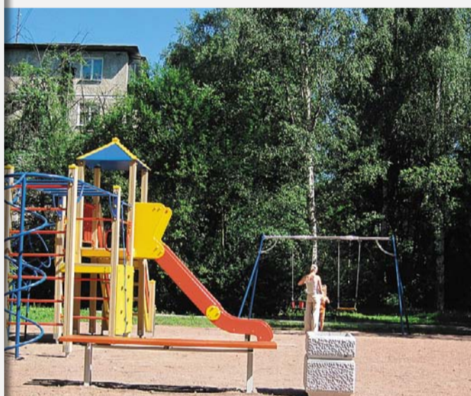
пр. Металлистов, д. 77, благоустройство завершено