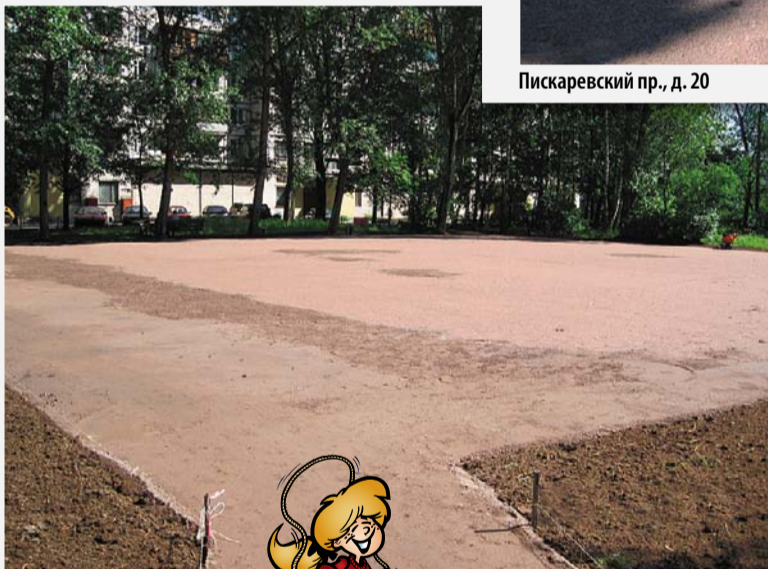
Пискаревский пр., д. 20