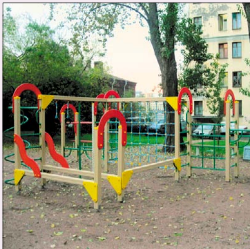
Во дворе на ул. Михайлова, д. д. 1 и 3