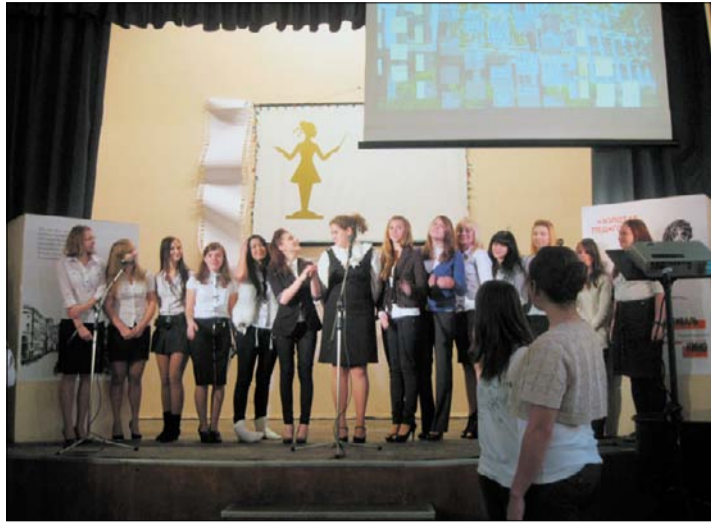
Студенты первого курса колледжа

И преподавателей, и студентов в этот день ждали сюрпризы. Не было привычных уроков и расписания. Перемены с уроками имели равную продолжительность – 30 минут. Каждый преподаватель стремился поразить воображение студентов – старался подготовить урок, который раскрыл бы его с неожиданной стороны, как человека, имеющего свое увлечение, любимое занятие или интересную биографию. В ответ на необыкновенные уроки студенты подготовили перемены-сюрпризы. На всех «площадках» колледжа одновременно происходил творческий процесс, в котором главными действующими лицами были учащи-