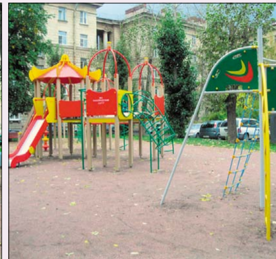
Новая детская площадка во дворе ул. Лабораторная, д. 8/53, Кондратьевский пр., д. 42, Полюстровский пр., д. 49