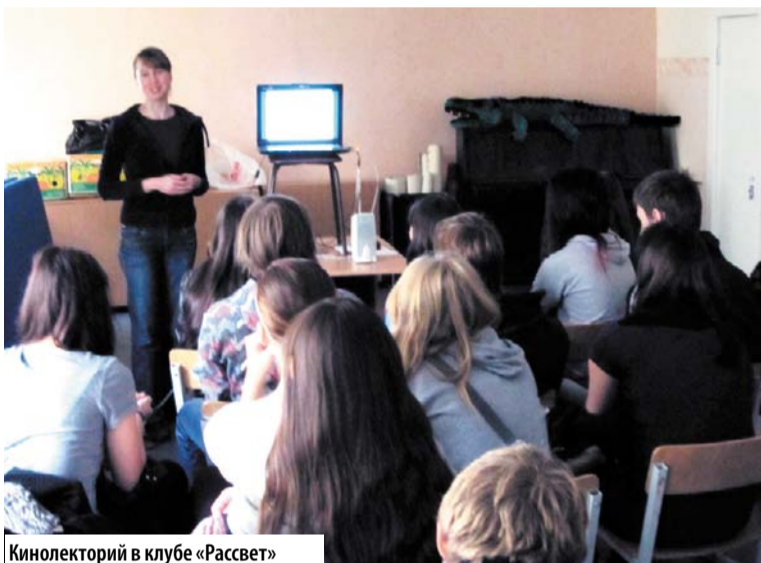
Кинолекторий в клубе «Рассвет»

В рамках мероприятий, организованных к Дню толерантности, специалистами СПбГУ «Контакт» был проведен ряд мероприятий с молодежью Финляндского округа. В подростковом клубе «Рассвет» прошел кинолекторий на тему «Человек в информационном пространстве», а в библиотеке «Истоки» был организован круглый стол для студентов технического колледжа управления и коммуникаций.