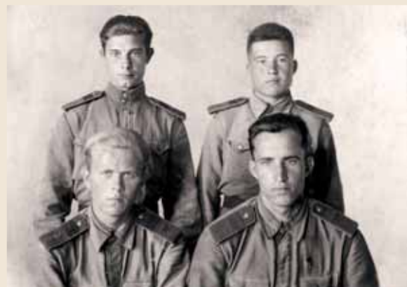
Матери от сына. Со своим боевым экипажем 24.09.1943 г.