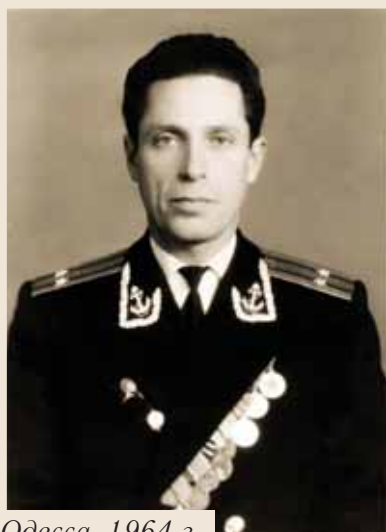
Одесса, 1964 г.