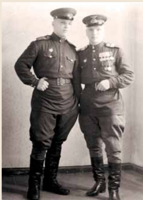
Сразу после войны

начальником технического отдела, затем работал инженером-технологом на заводе № 346. С 1961 года работал на заводе «Знамя Труда», прошел путь от инженера до заведующего отделом. На этом предприятии отработал 33 года до 1994 года. Воспитал сына (доктор технических наук), имеет внука и внучку.