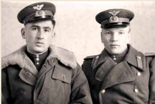
Германия, 1945 г.

начальником технического отдела, затем работал инженером-технологом на заводе № 346. С 1961 года работал на заводе «Знамя Труда», прошел путь от инженера до заведующего отделом. На этом предприятии отработал 33 года до 1994 года. Воспитал сына (доктор технических наук), имеет внука и внучку.