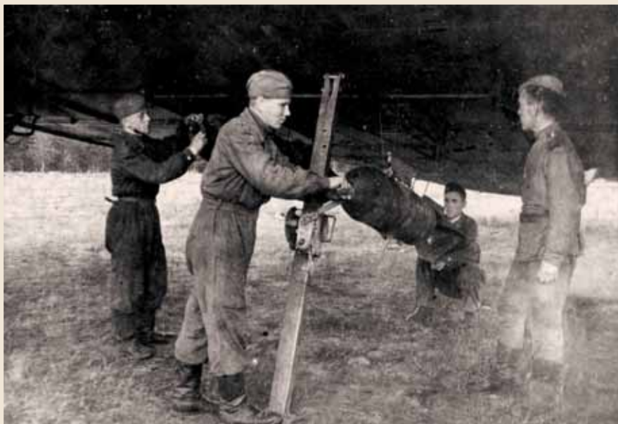
Зима 1943–1944 г.

градская область) — Брянская область — Вильнюс — Польша — Австрия.