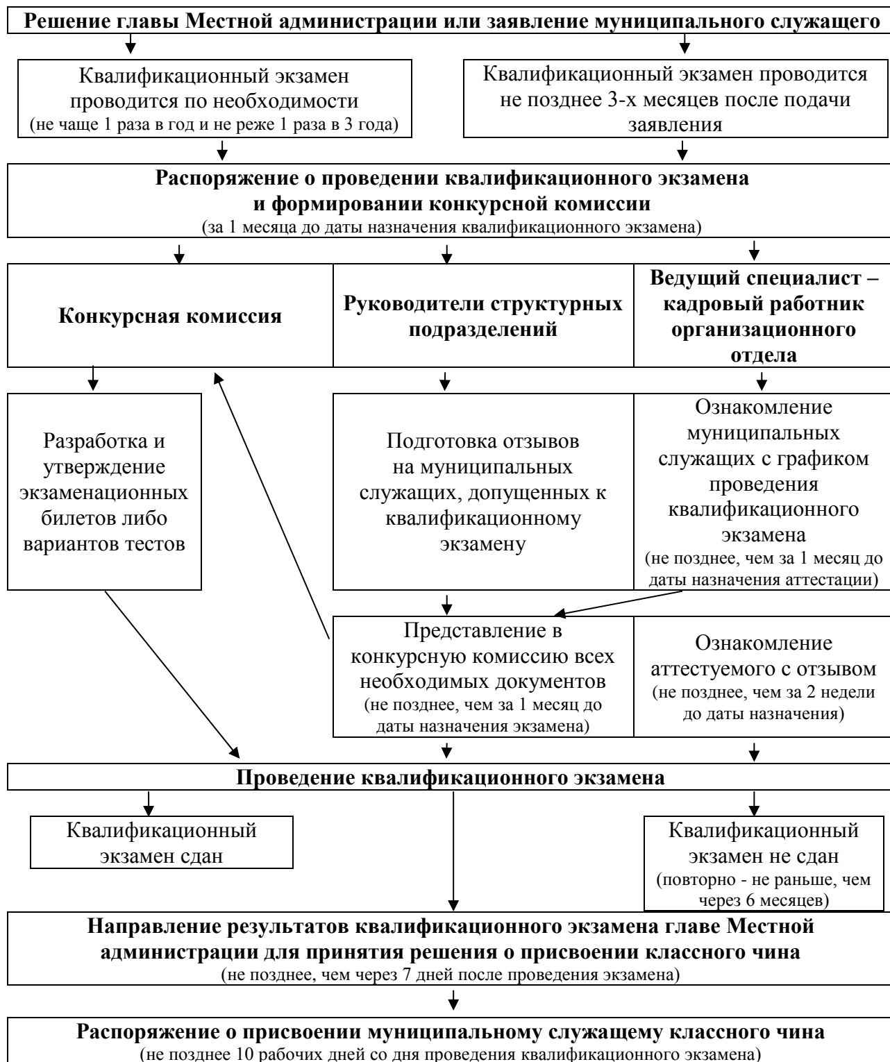
Схема проведения квалификационного экзамена