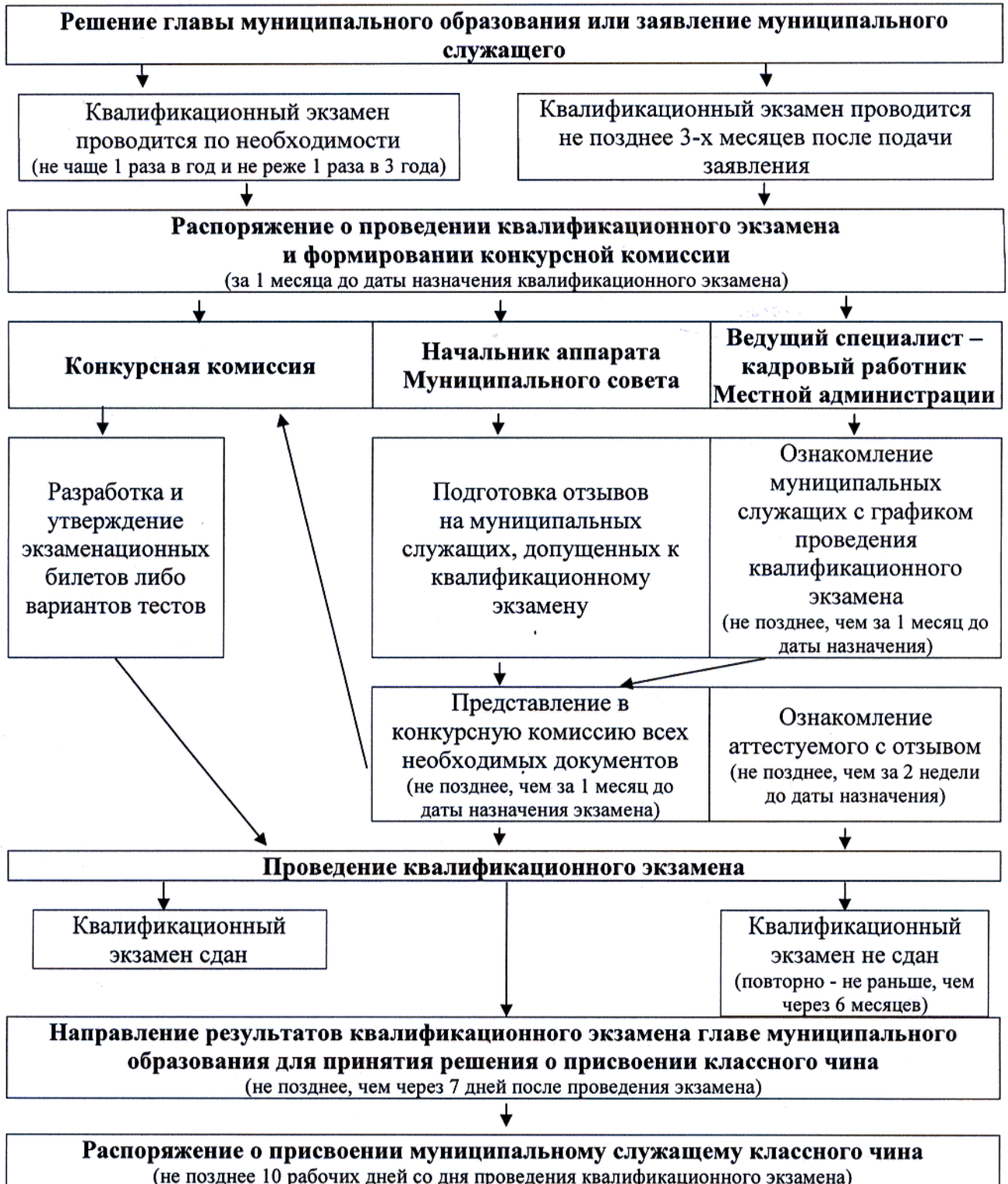
Схема проведения квалификационного экзамена