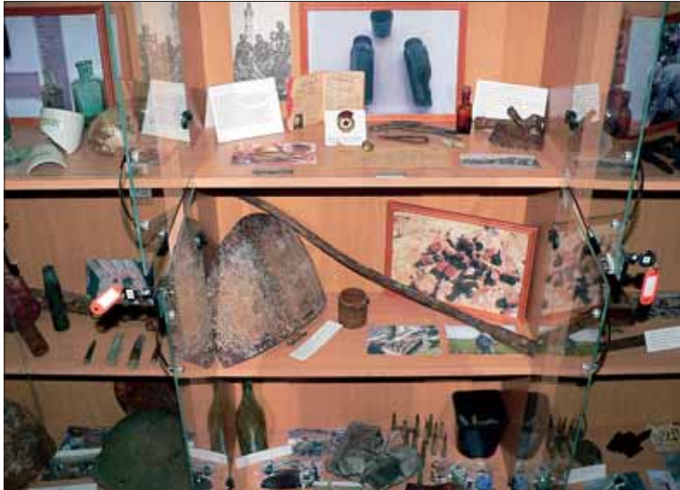
В комнате-музее Боевой славы