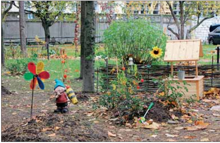
Во дворе на пр. Металлистов, д. 113