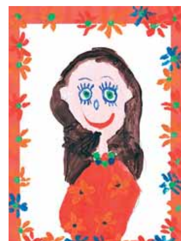
Максим Шишкин, 6 группа