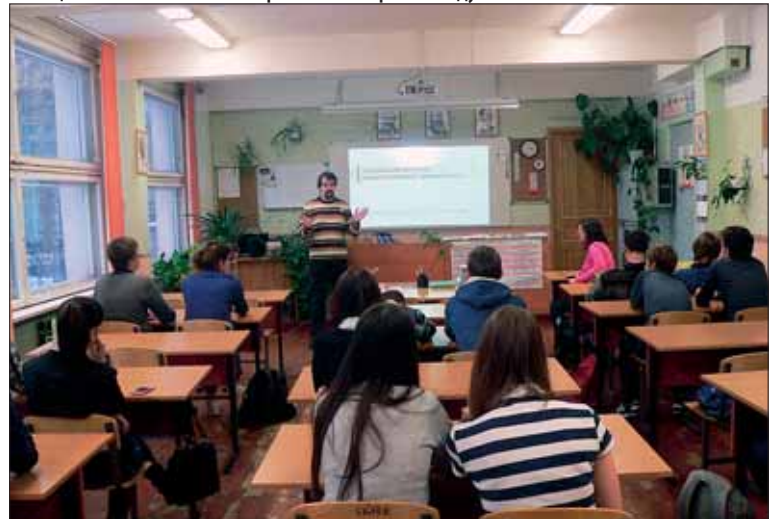
«Круглый стол» по профилактике наркозависимости