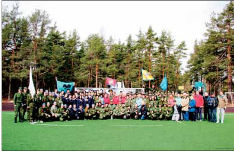
На военно-патриотическом сборе