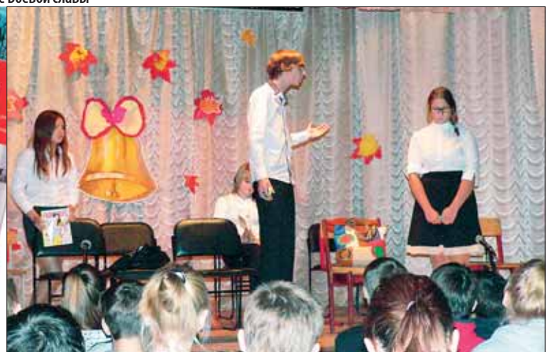
Сцена из спектакля по толерантности «Мир в твоей душе»