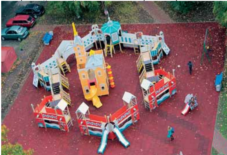
Детская площадка на Пискаревском пр., д. 10