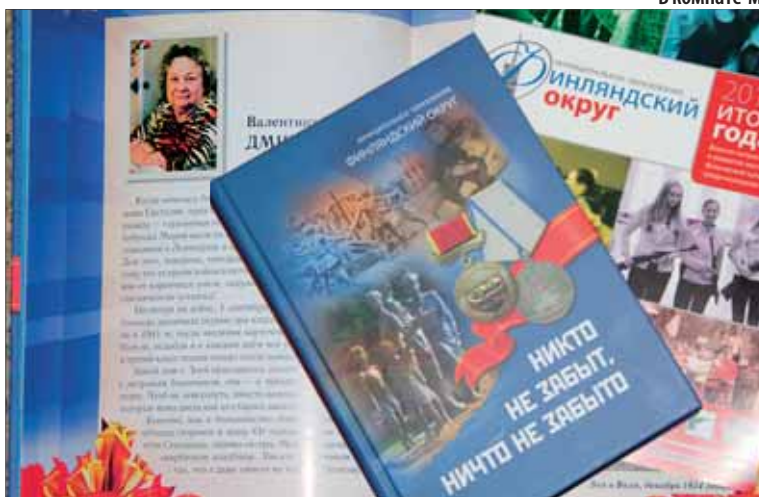
Материалы издательской деятельности по военно-патриотическому воспитанию