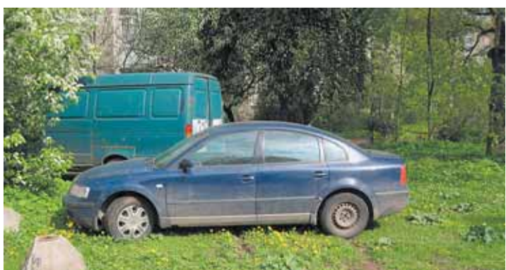
Газон – стоянка для богатых и упрямых (штраф – 5 тыс. руб.)