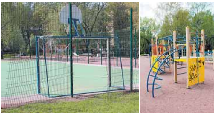
Во дворе ул. Федосеенко, д. 25 через год после благоустройства