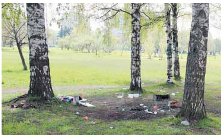
Погуляли в парке Сахарова...