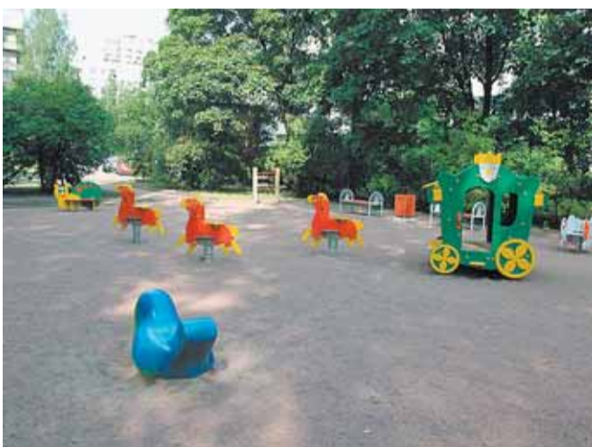
Кондратьевский пр., д. 75, корп. 2