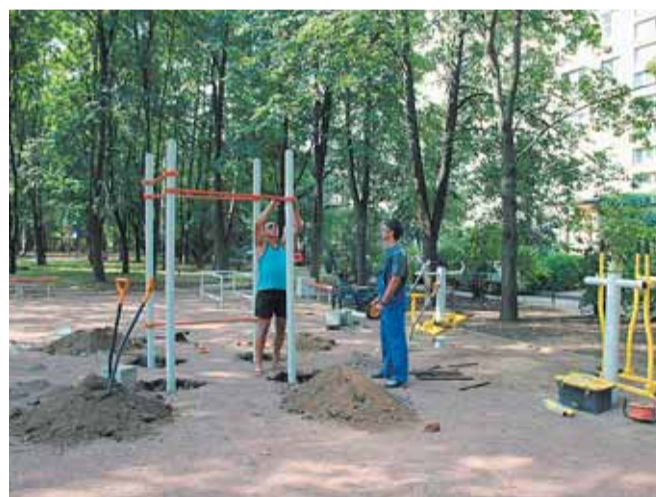
Кондратьевский пр., д. 83