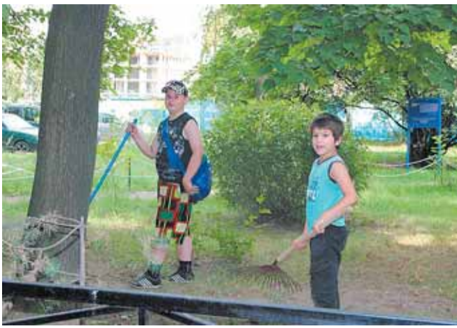
Во дворе на пр. Металлистов, д. 113

Как грибы после дождя вырастают летом в Финляндском округе современные детские площадки с игровым и спортивным оборудованием. Совсем недавно еще две появились во дворах на Кондратьевском проспекте, у дома 77, корпус 1 и дома 75, корпус 2.