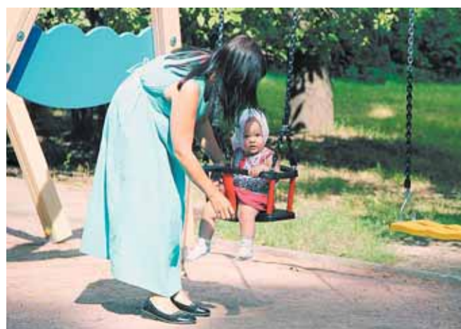
Кондратьевский пр., д. 75, корп. 2