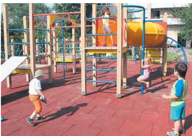
Кондратьевский пр., д. 77, корп. 1