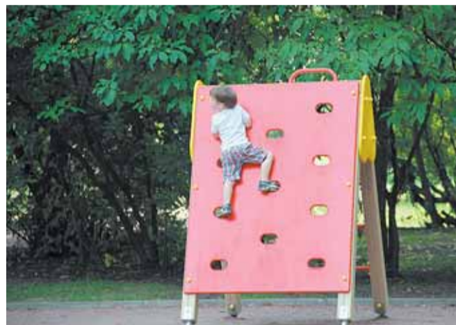
Кондратьевский пр., д. 75, корп. 2