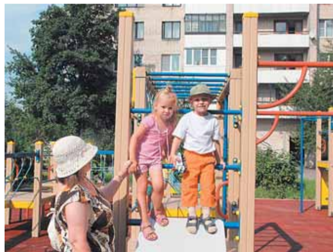
Кондратьевский пр., д. 77, корп. 1