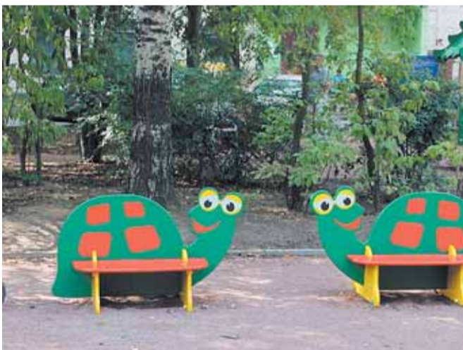
Кондратьевский пр., д. 75, корп. 2