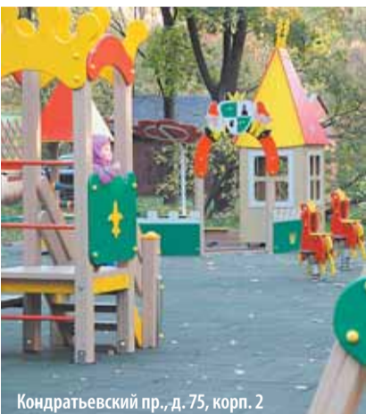
Кондратьевский пр., д. 75, корп. 2