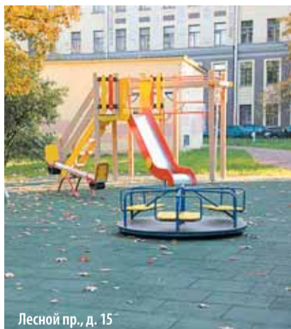
Лесной пр., д. 15

Во дворах на Кондратьевском пр., д. 75, корп. 2 и Лесном пр., д. 15 этим летом появились новые детские площадки с современным игровым оборудованием. И дети, и родители проведенными работами в целом были довольны. Яркие качели, карусели, горки, спортивные уголки, скамейки, песочницы, общий вид площадок – ничто не вызывало нареканий. Родители Муниципальный совет и Местную администрацию просили об одном: положить основание площадок