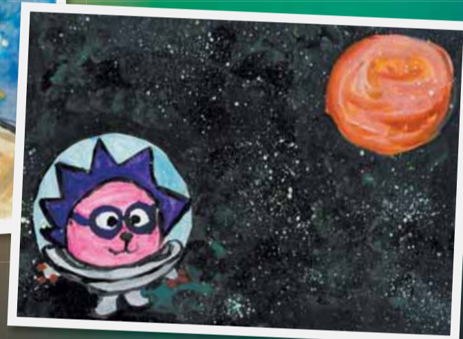
Табаченко Варя, 4 года, д/с №18