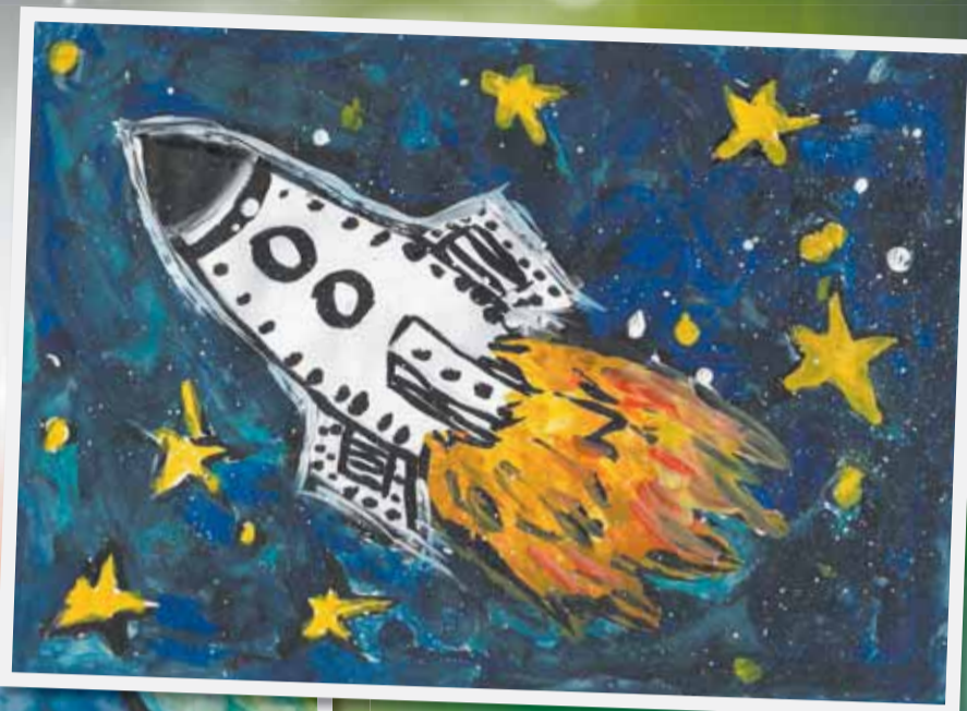
Трошева Полина, 4 года, д/с №18