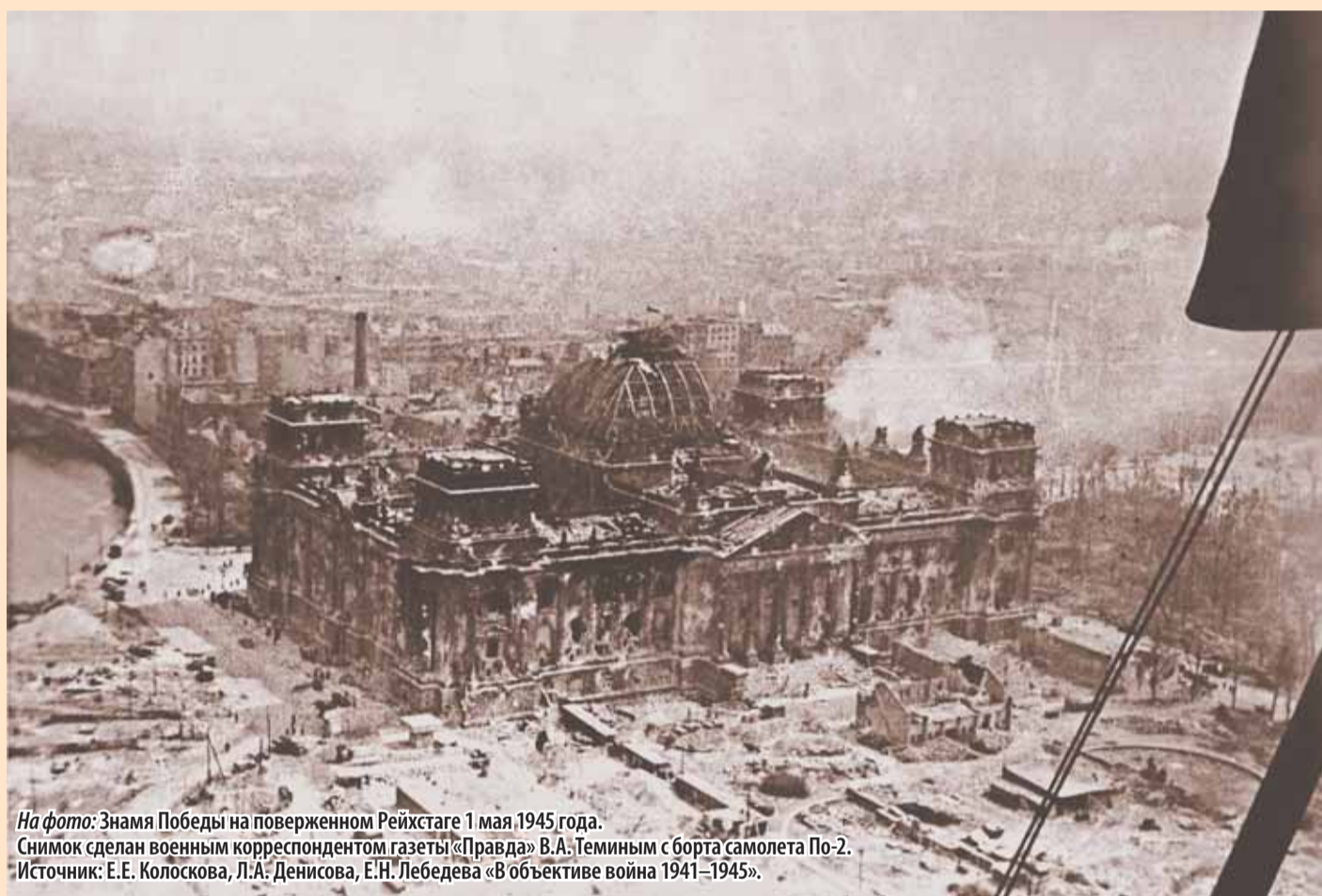
На фото: Знамя Победы на поверженном Рейхстаге 1 мая 1945 года. Снимок сделан военным корреспондентом газеты «Правда» В.А. Теминым с борта самолета По-2. Источник: Е.Е. Колоскова, Л.А. Денисова, Е.Н. Лебедева «В объективе война 1941–1945».