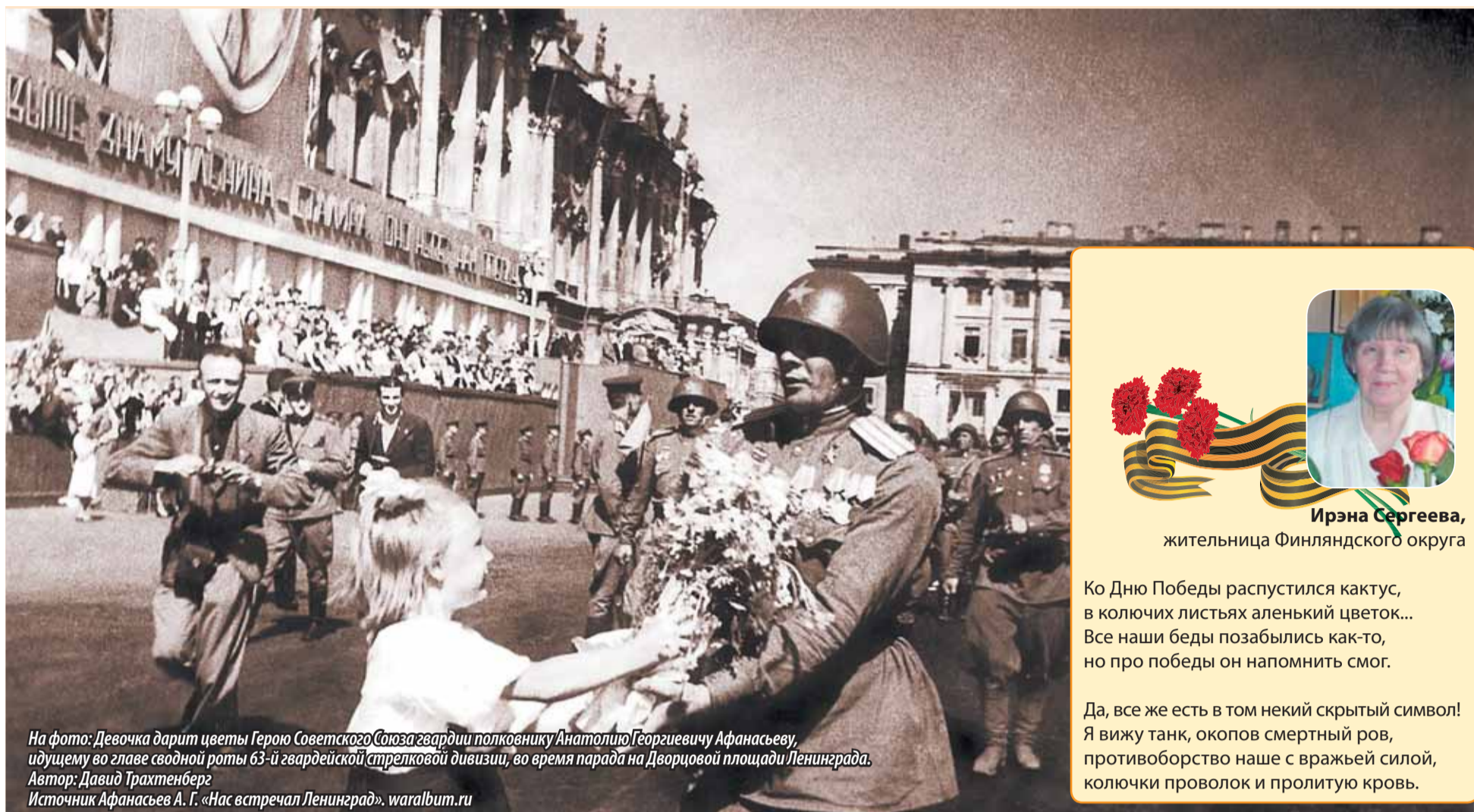
На фото: Девочка дарит цветы Герою Советского Союза гвардии полковнику Анатолию Георгиевичу Афанасьеву, идущему во главе сводной роты 63-й гвардейской стрелковой дивизии, во время парада на Дворцовой площади Ленинграда. Автор: Давид Трахтенберг Источник Афанасьев А. Г. «Нас встречал Ленинград». waralbum.ru