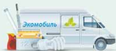
ГРАФИК РАБОТЫ «ЭКОМОБИЛЯ»

ПОМНИТЕ! Полная навалом опасные отходы загрязняют окружающую среду!