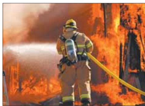
ПСО Калининского района Санкт-Петербурга