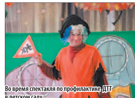
Во время спектакля по профилактике ДТП в детском саду