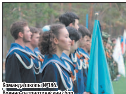
Команда школы №186. Военно-патриотический сбор

I место в номинациях «Лучшая организация и проведение мероприятий по профилактике правонарушений, терроризма и экстремизма», «Лучший музей (комната) боевой славы, созданный в муниципальном образовании»;