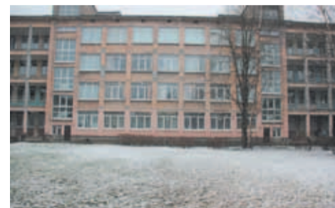
Памятник примирения будет стоять в центре школьного двора