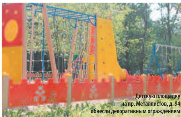
Детскую площадку на пр. Металлистов, д. 94 обнесли декоративным ограждением

Приглашаем всех, кого волнует состояние наших дворов, детских площадок, спортивных зон и зон отдыха, на общественные обсуждения плана благоустройства, которые состоятся 27 сентября в 18:00 по адресу: пр. Металлистов, д. 93 «А», зал заседаний. Нам важно знать ваше мнение!