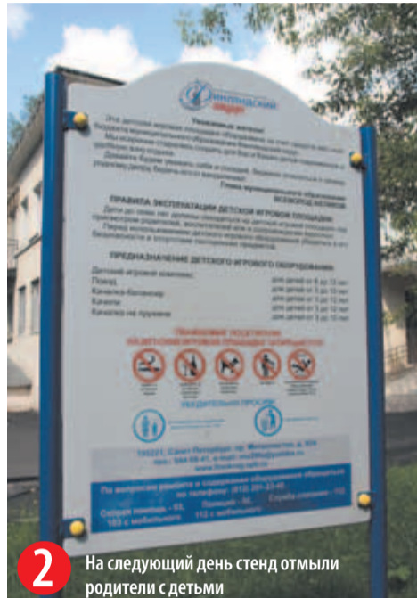
2 На следующий день стенд отмыли родители с детьми

Все это безобразие вовремя заметила Г.Г. Левкова и вместе с заместителем главы муниципального образования И.С. Кудиновым вызвала родителей детей, которые в это время находились дома, и сотрудников 21-го отдела полиции.