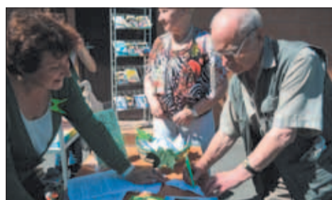
Участник акции пишет пожелание на эко-бабочке, сделанной библиотекарями в технике оригами

«Час Зеленого Творчества» – это международная акция, направленная на улучшение нашего мира и заботу об окружающей среде; час единых действий, посвященный планете Земля. Согласно договоренности в разных точках мира, 1 августа в 13:00 по местному времени творческие люди всех национальностей и возрастов объединились и провели в своих городах мероприятия, призванные показать, как можно изменить экологическую ситуацию на планете к лучшему. А «Зеленый ангел Петербурга» – социокультурное мероприятие, которое организовали и провели сотрудники библиотеки в рамках «Часа Зеленого Творчества».