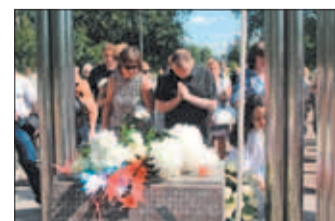
Участники митинга возлагают цветы к памятнику