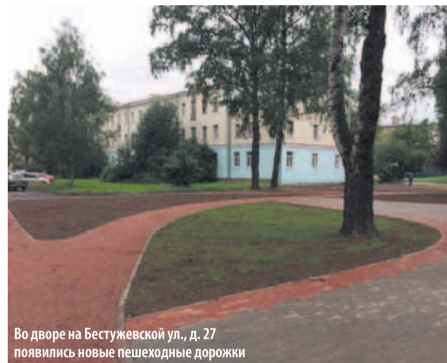
Во дворе на Бестужевской ул., д. 27 появились новые пешеходные дорожки

Местная администрация Финляндского округа просит жителей бережно относиться к своим дворам, детским площадкам, игровому оборудованию, цветникам и газонам.