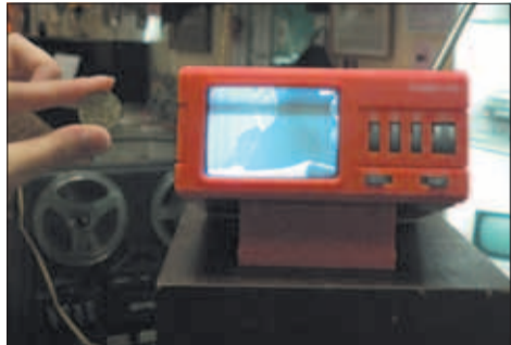
На этом телевизоре и сейчас можно смотреть привычные нам телеканалы