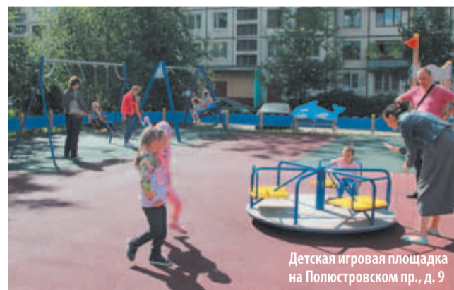
Детская игровая площадка на Полюстровском пр., д. 9