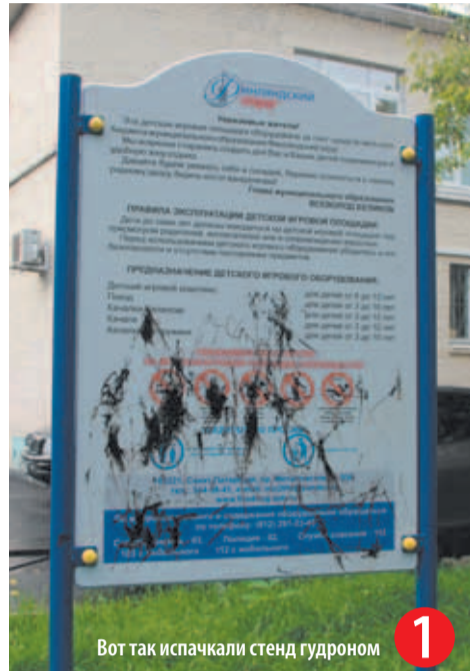
Вот так испачкали стенд гудроном 1

в доме (а точнее – во дворе) хозяин, и в отместку выпачкали гудроном информационный щит, установленный на детской площадке, и две иномарки, оставленные на месте для парковки у здания муниципалитета.