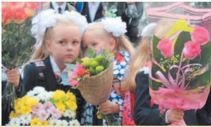
Первоклассники школы № 138 на торжественной линейке 1 сентября 2016 года