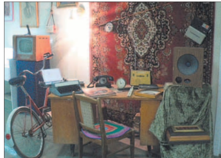
Велосипед, печатная машинка, ковер и удочка на стене, быт советского человека – как отражение великой эпохи