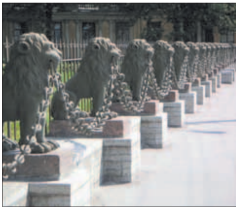
Львиная ограда на Свердловской наб., д. 40.

Граф сначала привёз Дюма в свой трёхэтажный угловой особняк на Гагаринской набережной (современная набережная Кутузова), где тот присутствовал на молебне по случаю «благополучного прибытия», который отслужил домашний священник в парадном зале на втором этаже.