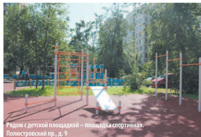
Рядом с детской площадкой – площадка спортивная. Полюстровский пр., д. 9