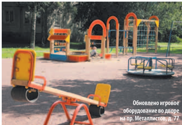
Обновлено игровое оборудование во дворе на пр. Металлистов, д. 77