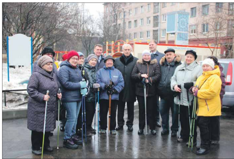
Губернатор Санкт-Петербурга Г. С. Полтавченко, глава администрации Калининского района В. А. Пониделко, глава Финляндского округа В. Ф. Беликов с жителями

На встрече также поднимались проблемы благоустройства, было подчеркнуто, что петербуржцы озабочены состоянием парков и скверов, сохранением зеленого фонда. Как Председатель совета муниципальных образований Санкт-