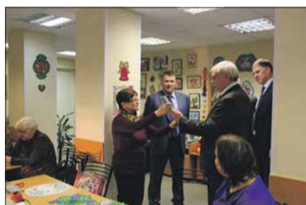
Губернатор Г. С. Полтавченко в досуговом центре Финляндского округа

Далее – общение в зале заседаний с депутатским активом, главой Калининского района и представителями общественных организаций. Прежде чем приступить к разговору, губернатор подходит к участникам встречи и, здороваясь, жмет руку каждому.