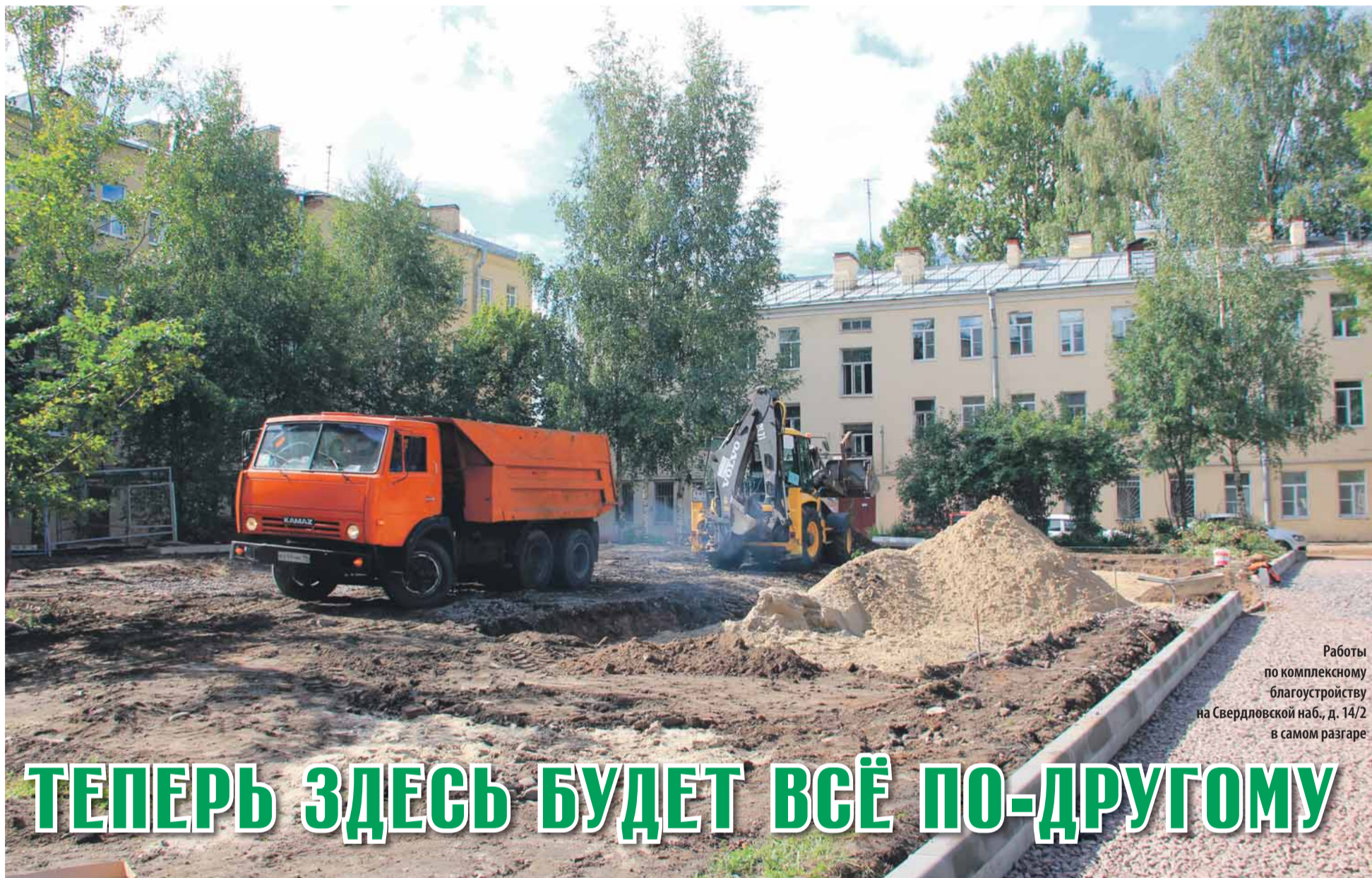
Работы по комплексному благоустройству на Свердловской наб., д. 14/2 в самом разгаре