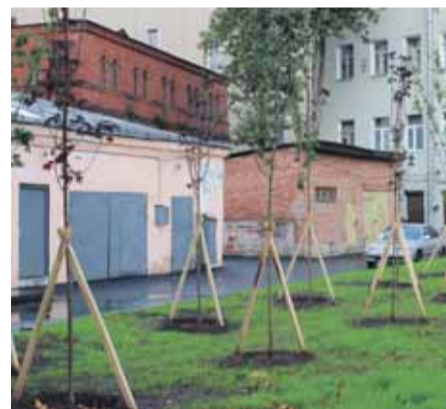
Молодые саженцы деревьев. Свердловская наб., д. 14/2