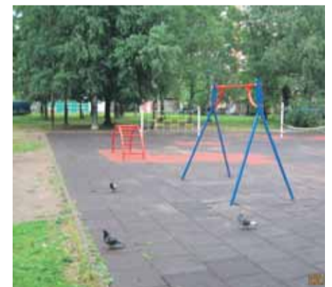
Пискаревский пр., д. 10