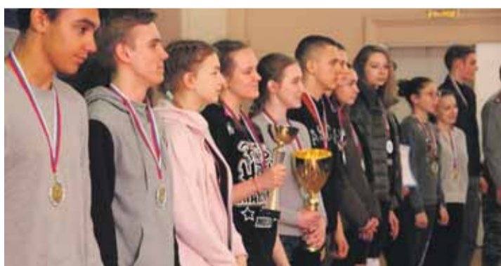
Вручение кубков и медалей