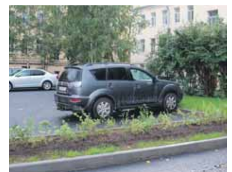
Дополнительные парковочные места на Свердловской наб., д. 14/2