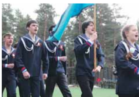
Команда школы № 186