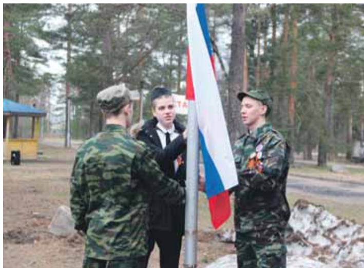
Капитаны команд на поднятии флага при открытии военно-патриотического сбора