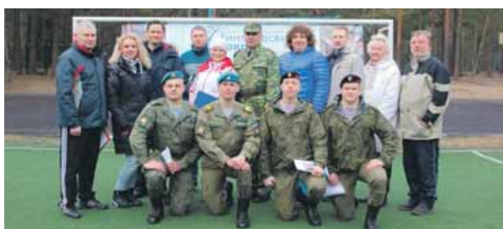
Депутаты, муниципальные служащие МО Финляндский округ и курсанты МВАА