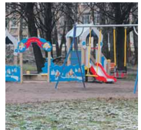
Кондратьевский пр., д. 83/2