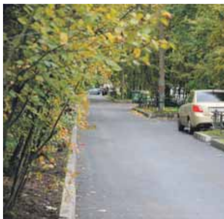
ул. Бестужевская, д. 31. Замена асфальтового покрытия