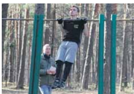
Подтягивание на перекладине