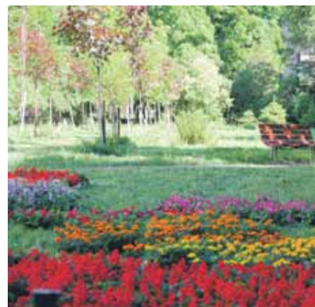
ул. Замшина, д. 31, корп. 3