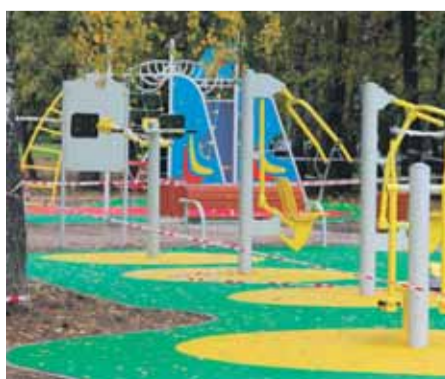
Кондратьевский пр., д. 81/1