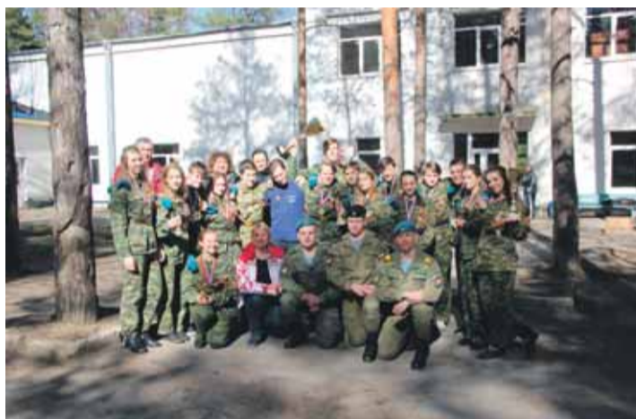
Команда школы № 138 – победитель военно-патриотического сбора

Объективной оценкой нашей работы в этом направлении можно считать два вторых места – «За лучшую организацию работ по военно-патриотическому воспитанию граждан» и «За лучший музей (комнату боевой славы) муниципального образования», которые наш округ занял в городском конкурсе в 2018 году.