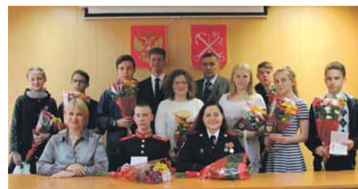
Вручение паспортов в Муниципальном совете