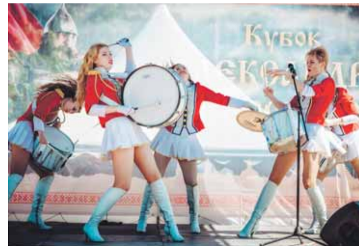
Выступление группы барабанищи на военно-патриотической реконструкции «Кубок Александра Невского» в Любашинском саду