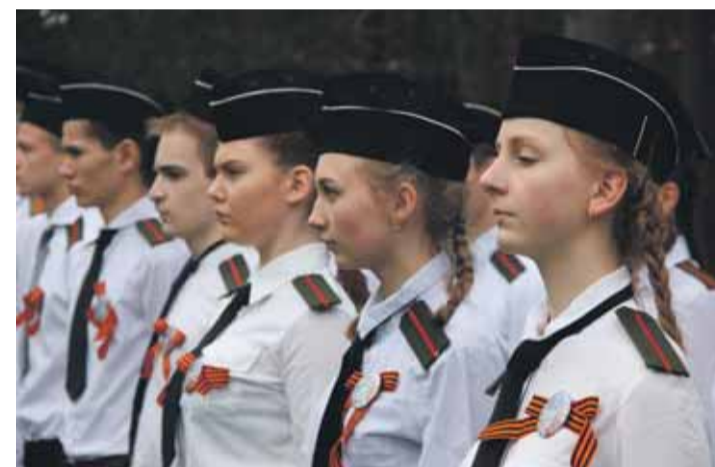
Команда школы № 139