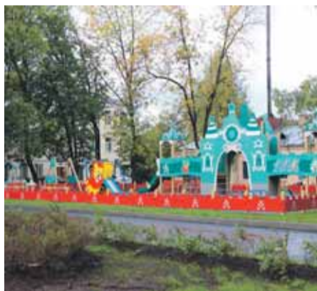
Во дворе на Свердловской наб., д. 14/2 теперь есть Изумрудный город

И это еще не всё. Более подробно обо всех работах по благоустройству, выполненных в 2018 году, можно узнать на сайте МО Финляндский округ fipokrug.spb.ru , в разделе «Муниципальные программы».