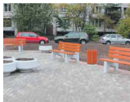
Зона отдыха во дворе на Кондратьевском пр., д. 79–81/1