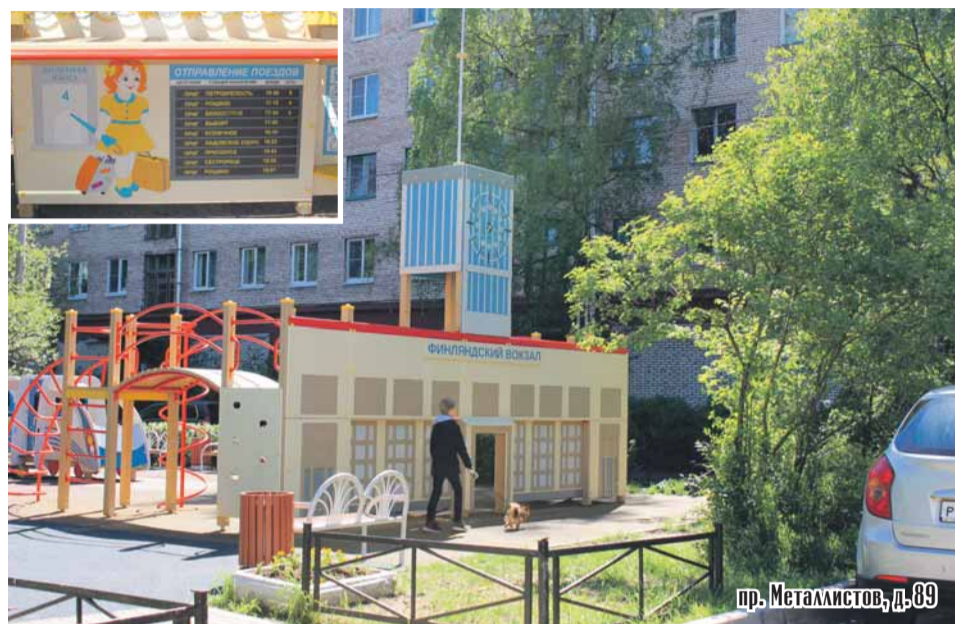
пр. Металлистов, д. 89