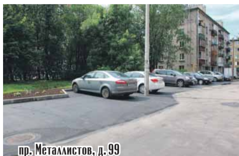
пр. Металлистов, д. 99