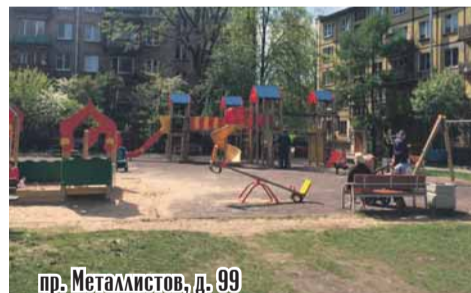
пр. Металлистов, д. 99

266 / 2541 Посадка деревьев и кустарников