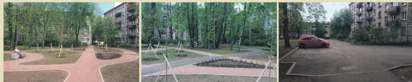
Зона отдыха, дополнительные парковочные места на ул. Федосеенко, д. 30

2 Демонтаж травмоопасного игрового оборудования