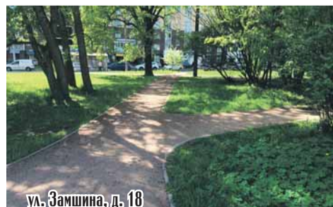
ул. Замшина, д. 18