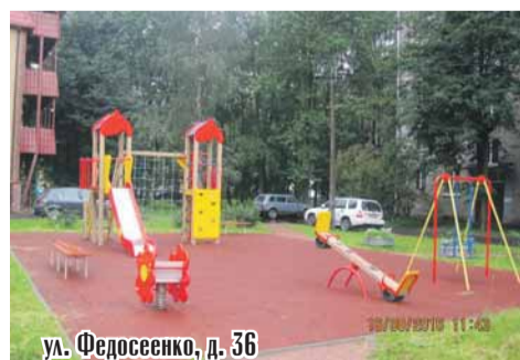
ул. Федосеенко, д. 36