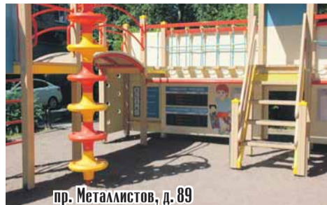
пр. Металлистов, д. 89