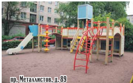
пр. Металлистов, д. 89

Большой объем работ выполнен между домами 56 и 60/19 на Кондратьевском проспекте.