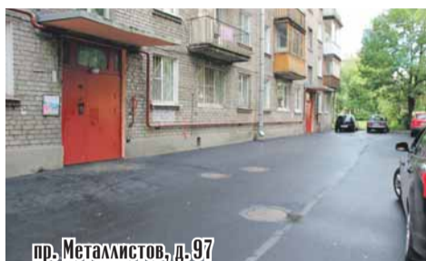
пр. Металлистов, д. 97