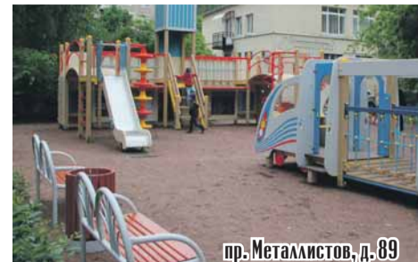
пр. Металлистов, д. 89