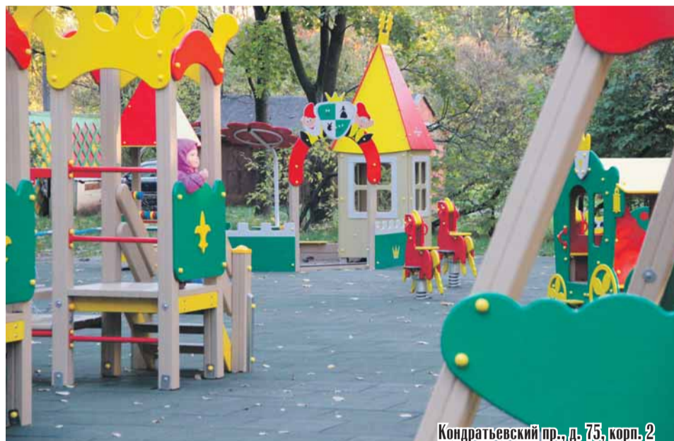
Кондратьевский пр., д. 75, корп. 2