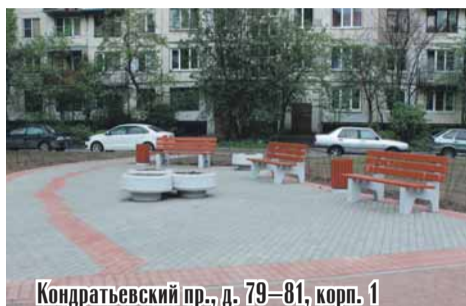
Кондратьевский пр., д. 79–81, корп. 1