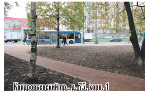
Кондратьевский пр., д. 75, корп. 1