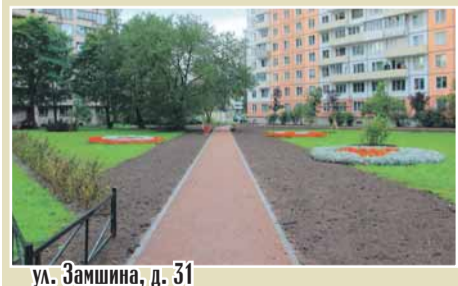
ул. Замшина, д. 31