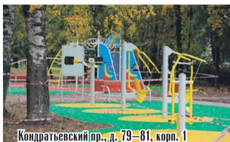
Кондратьевский пр., д. 79–81, корп. 1