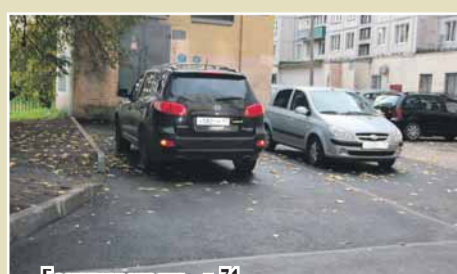
Бестужевская ул., д. 31