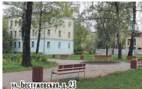
ул. Бестужевская, д. 23