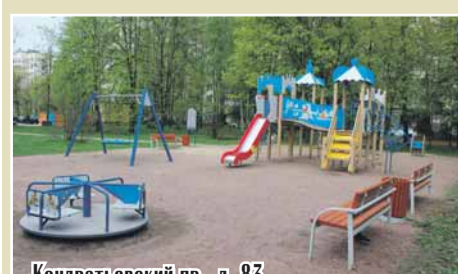
Кондратьевский пр., д. 83