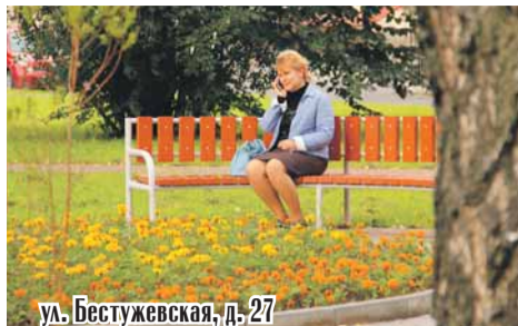
ул. Бестужевская, д. 27

В 2019 году будет завершен текущий ремонт асфальтового покрытия, работы по восстановлению газонов, обустройству щебеночно-набивных дорожек, зоны отдыха в квартале, ограниченном пр. Маршала Блюхера, Пискаревским пр., ул. Бестужевской и ул. Замшина.