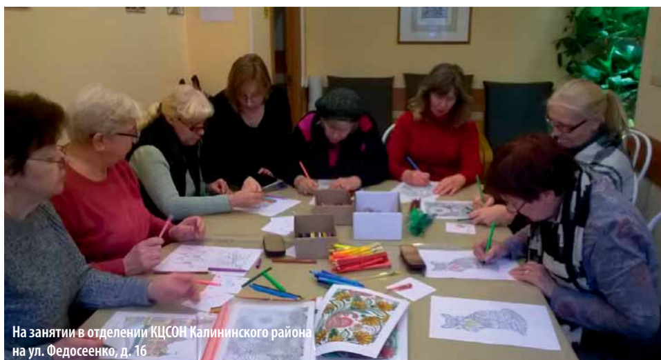
На занятии в отделении КЦСОН Калининского района на ул. Федосеенко, д. 16