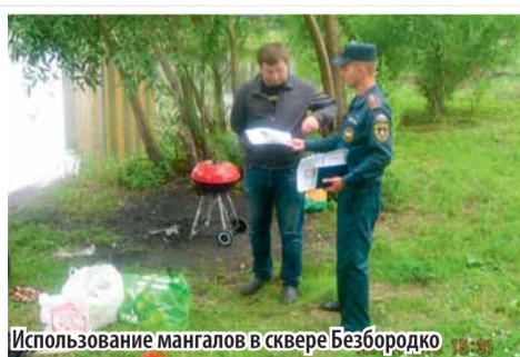
Использование мангалов в сквере Безбородко