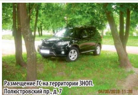
Размещение ТС на территории ЗНОП. Полюстровский пр., д. 7