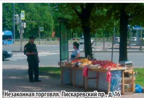
Незаконная торговля. Пискаревский пр., д. 16