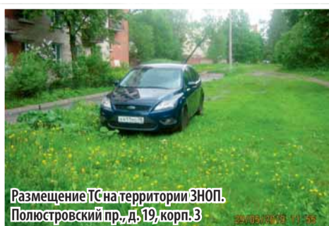
Размещение ТС на территории ЗНОП. Полюстровский пр., д. 19, корп. 3