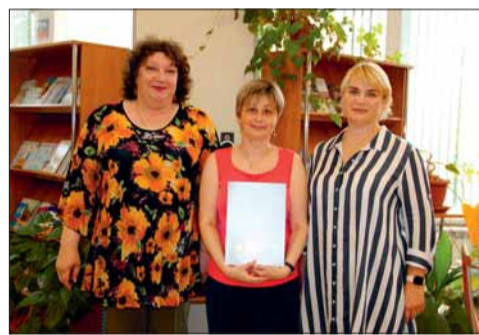
здому «ученику» здесь находили свой подход. Спокойная, уютная атмосфера на занятиях способствовала продуктивному обучению.

Несмотря на то, что занятия по обучению компьютерной грамотности групповые, к ка-