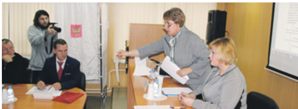
Подсчет голосов при выборе главы муниципального образования Финляндский округ