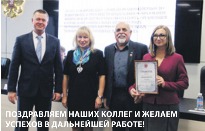
ПОЗДРАВЛЯЕМ НАШИХ КОЛЛЕГ И ЖЕЛАЕМ УСПЕХОВ В ДАЛЬНЕЙШЕЙ РАБОТЕ!

III место – в номинации «Лучшая организация работ по развитию на территории муниципального образования физической культуры и массового спорта» в городском конкурсе на лучшую организацию работ по развитию физкультуры и спорта