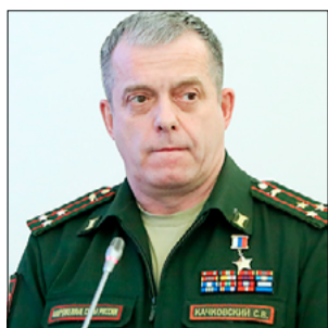
Военный комиссар г. Санкт-Петербурга Герой Российской Федерации, полковник С.В. Качковский