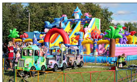
Зона аттракционов. День знаний, 2019 г.

каруселях, кто-то учился составлять букеты из полевых цветов, немало было и тех, кто захотел сделать открытку собственными руками и нанести рисунок на лицо с помощью аквагрима – так что при желании каждый смог найти занятие по душе. Фотографии с мероприятия можно посмотреть на сайте Финляндского округа: finokrug.spb.ru/new/info/4700 .