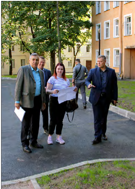
ул. Комсомола, д. 5–7–13–15

Программа по благоустройству Финляндского округа успешно выполняется. Уже проведены работы по замене асфальтового покрытия внутридворовых территорий на ул. Академика Лебедева, д. 16 и 20, Кондратьевском пр., д. 1/Арсенальной ул., д. 1.