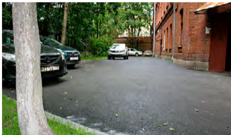
ул. Академика Лебедева, д. 16.