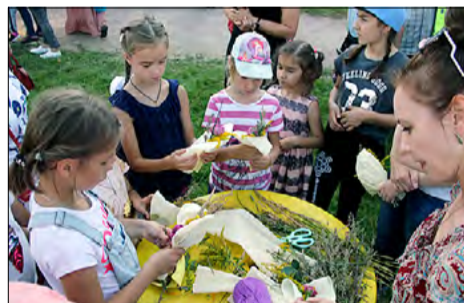
Составление букетов. День знаний, 2019 г.