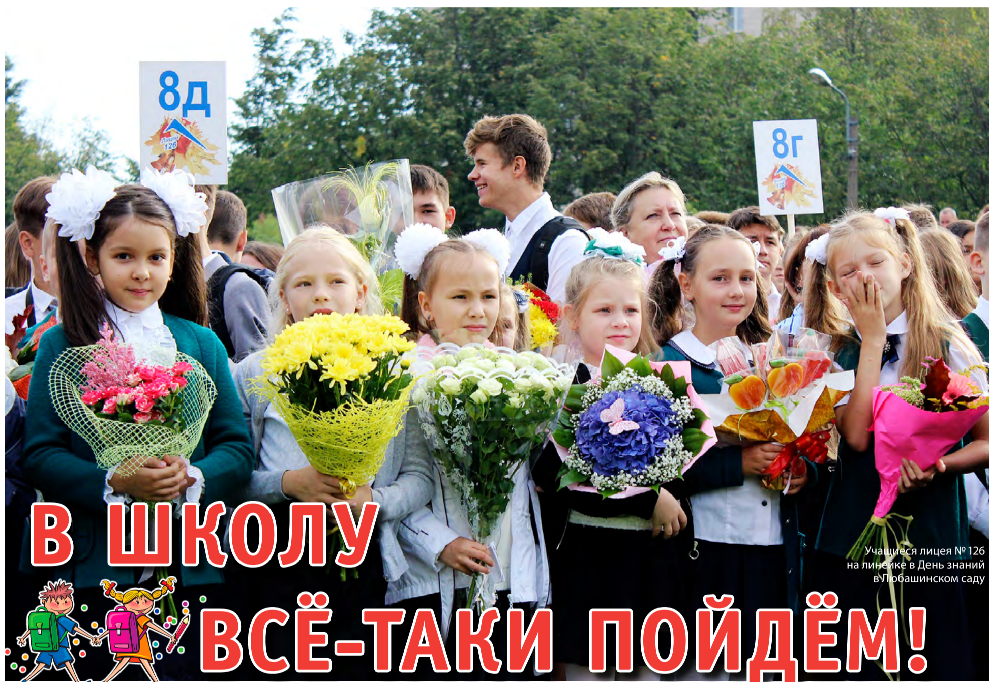
Учащиеся лицея № 126 на линейке в День знаний в Любашинском саду