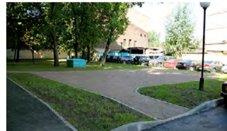
ул. Комсомола, д. 5–7–13–15.