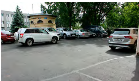
Кондратьевский пр., д. 1 – Арсенальная ул., д. 1.

Установка аварийно-строительных конструкций: Замшина ул., д. 27, корп. 1, лит. А.