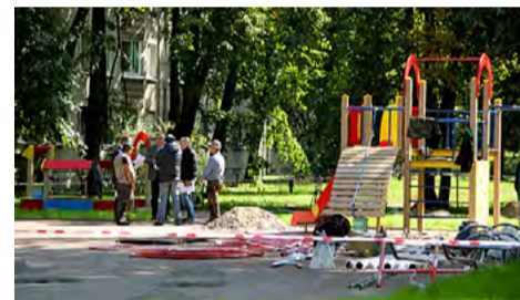
Кондратьевский пр., д. 39. Инспектирование работ