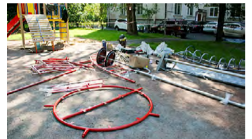
Кондратьевский пр., д. 39.