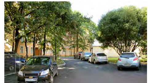
ул. Комсомола, д. 5–7–13–15.