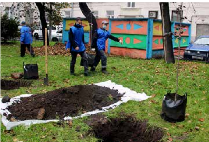
Во дворе на Кондратьевском пр., д. 39 в рамках программы «Формирование комфортной городской среды» высадили две липы, 18 саженцев красного и сахаристого клёна.