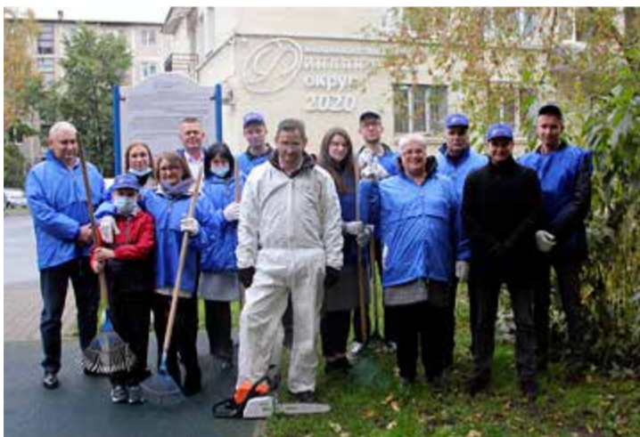
7 октября служащие Местной администрации Финляндского округа вышли на субботник во дворе между домами 87, 89, 91 на пр. Металлистов. Дружной командой они убрали опавшие листья, сухие ветви и мусор.