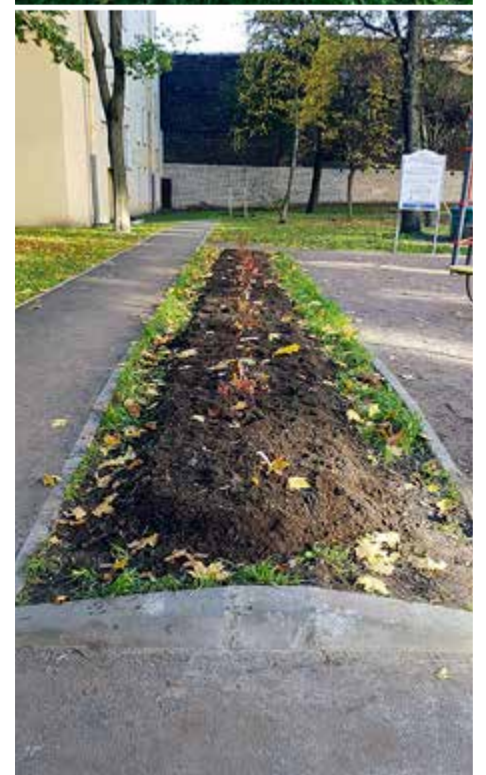
Во дворе на ул. Комсомола, д. 13 высадили три липы, две березы и 15 кустов спиреи.