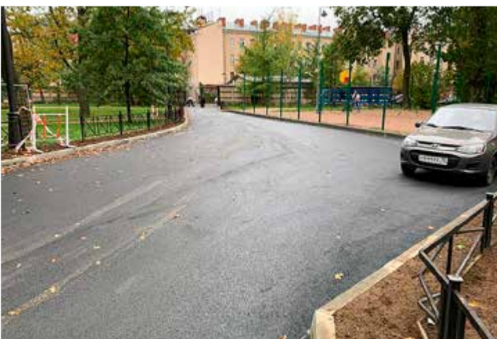
Завершились работы по благоустройству на ул. Михайлова, д. 10. Здесь заменили асфальтовое покрытие и бордюрный камень, восстановили газон. Все работы проводились за счет местного бюджета муниципального образования Финляндский округ.