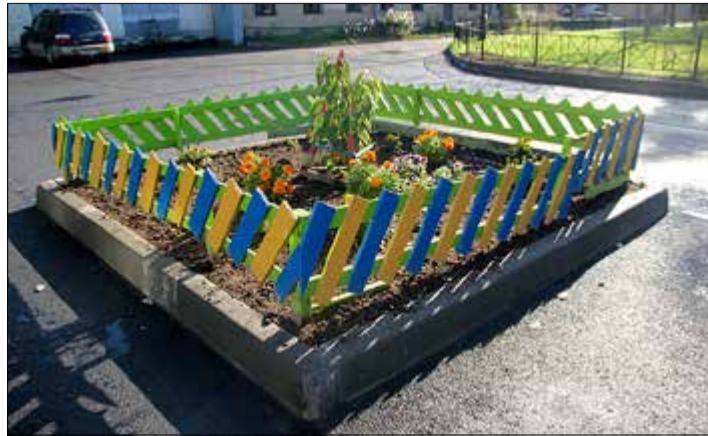
Палисадник-малыш с саженцем сакуры

Жители очень благодарны за помощь администрации детского сада № 2 ОАО «РЖД». «Летом в жаркие дни детский сад нам