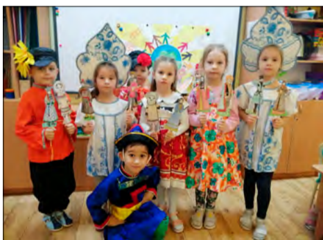
1-е место – Группа «Цветик-семицветик»