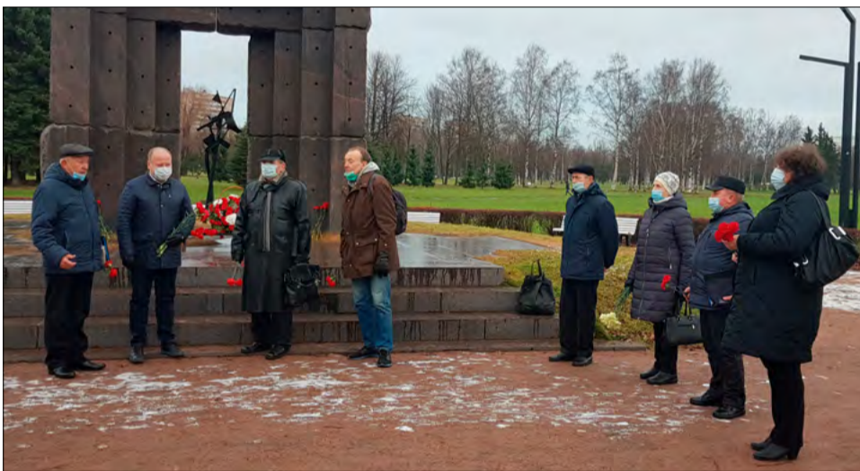
В Парке академика Сахарова у памятника «Жертвам радиационных аварий и катастроф» 30 ноября состоялась торжественная церемония возложения цветов в память о погибших в радиационных авариях и катастрофах.

Церемония, собиравшая ежегодно сотни участников, в число которых входили представители городской и районной администраций, ликвидаторы последствий аварий на ЧАЭС и ПО «Маяк», члены общественных организаций, учащиеся, представители органов местного самоуправления, простые жители города, оказалась немногочисленной. Это связано с введенными во время пандемии ограничениями на проведение мероприятий.