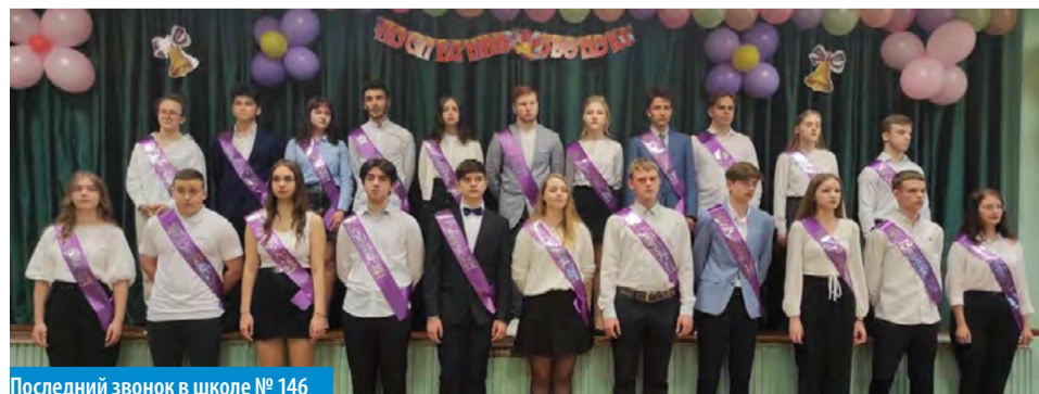
Последний звонок в школе № 146