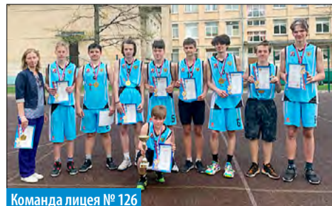
Команда лицея № 126

Муниципальный совет Финляндского округа благодарит преподавателей физ-