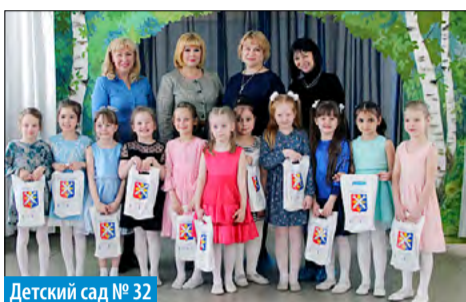
Детский сад № 32

О прошедших фестивалях мы писали в газете, печатали фотографии исполните-