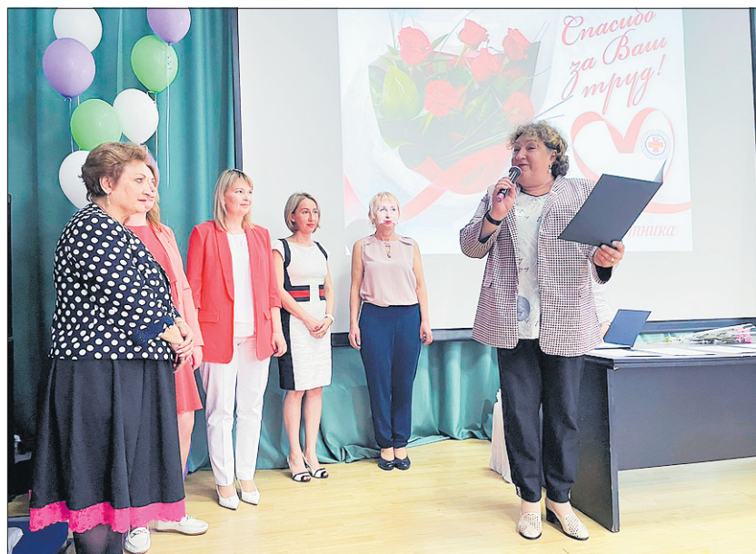
Чествование медицинских работников в Городской поликлинике № 76