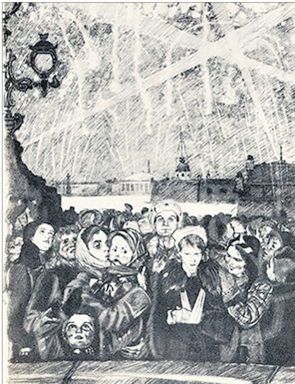
А.Ф. Пахомов «Салют в честь снятия блокады»