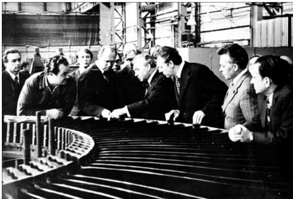
Г.В. Романов на Ленинградском металлургическом заводе. 1977 г.

Труд всегда был основанием человеческой жизни и культуры. Результатом труда Романов видел социально значимый продукт, полезный государству и обществу. Всю свою жизнь он признавал настоящими героями только людей, которые любят и умеют работать.