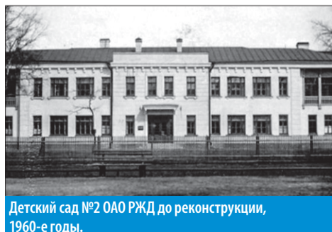
Детский сад №2 ОАО РЖД до реконструкции, 1960-е годы.

Адреса участковых избирательных комиссий ..... 8